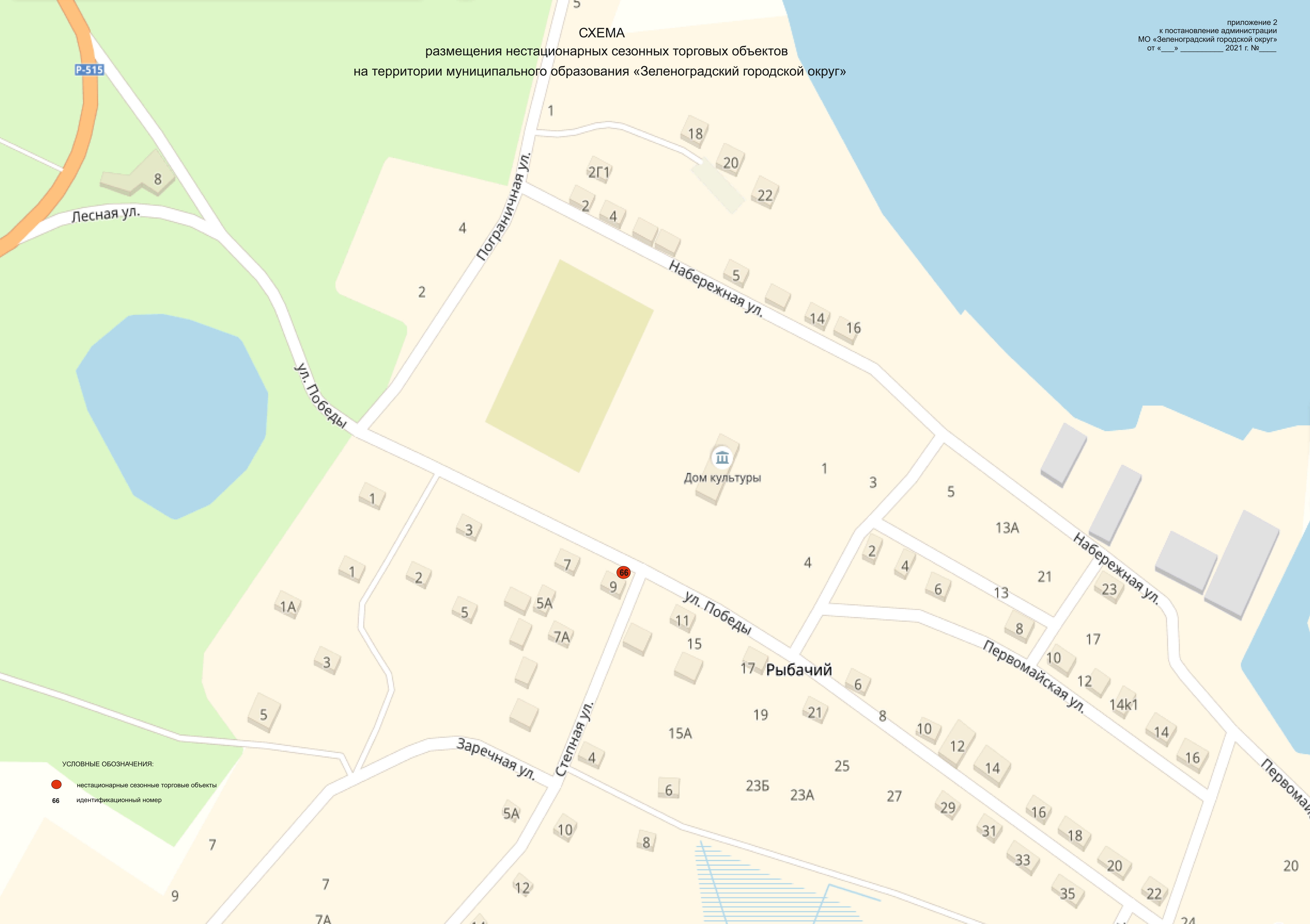
СХЕМА размещения нестационарных сезонных торговых объектов на территории муниципального образования «Зеленоградский городской округ»