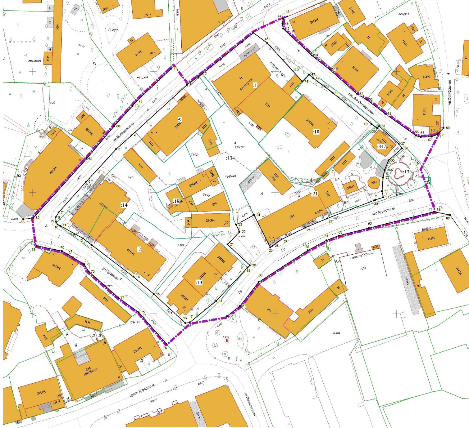
Исходный вариант характеристик точек устанавливаемых красных линий