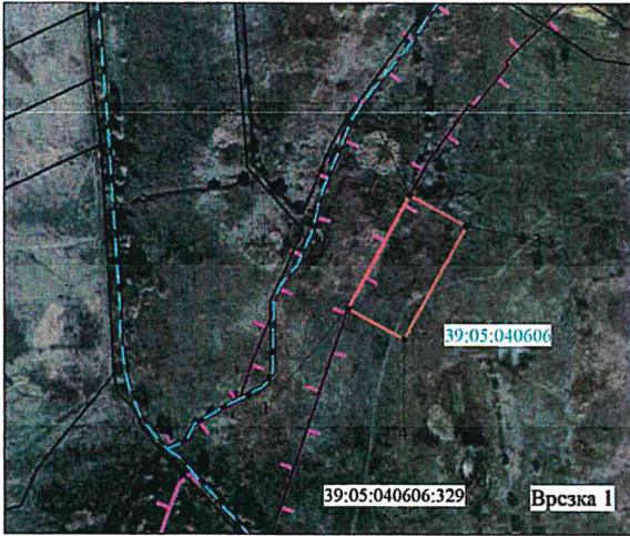
Масштаб 1:5 000