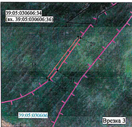
Масштаб 1:5 000